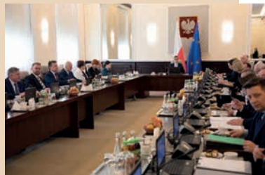
▲ W Polsce to nie prezydent, lecz rząd dysponuje największymi uprawnieniami. Na zdjęciu: pierwsze posiedzenie Rady Ministrów pod przewodnictwem nowego premiera, Mateusza Morawieckiego, styczeń 2018 r.

Rząd wpływa na pracę parlamentu, zgłaszając własne projekty ustaw. Szczególnie istotnym obowiązkiem rządu jest przygotowanie budżetu – planu dochodów i wydatków państwa na następny rok.