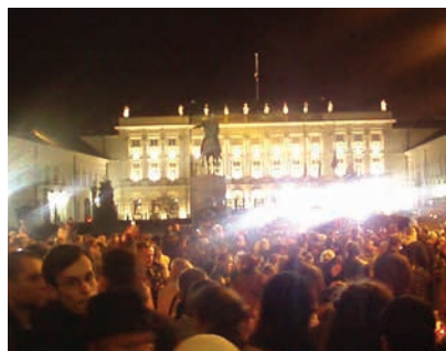
▲ Po katastrofie tysiące Polaków uczciło pamięć pary prezydenckiej i wszystkich ofiar.

Tragiczny wypadek tylko na krótko zjednoczył Polaków. Szybko pojawiły się kontrowersje dotyczące jego przyczyn oraz spory wokół sposobu wyjaśniania i ustalania winnych tragedii, które trwają do dziś.