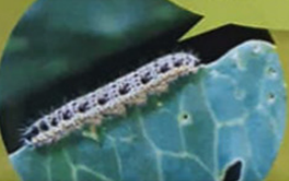
gąsienica bielinka kapustnika